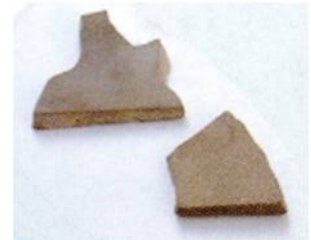
田和山遺跡出土石硯片