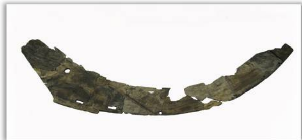
写真右：「船片」 船首、船端の横板上部と思われる。