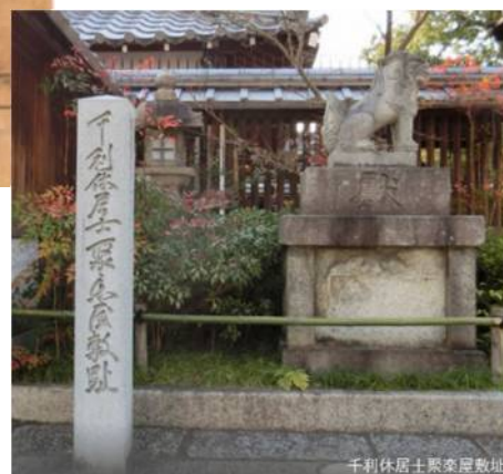
千利休居士聚楽屋敷址

利休屋敷について、元禄4年に書かれた「茶道要録」には、「葎屋町通り元誓願寺下ル町也」とある。