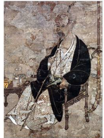
伝岩佐又兵衛（自画像） MOA美術館