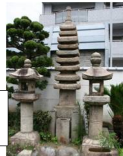
墨染寺の 九重の石塔