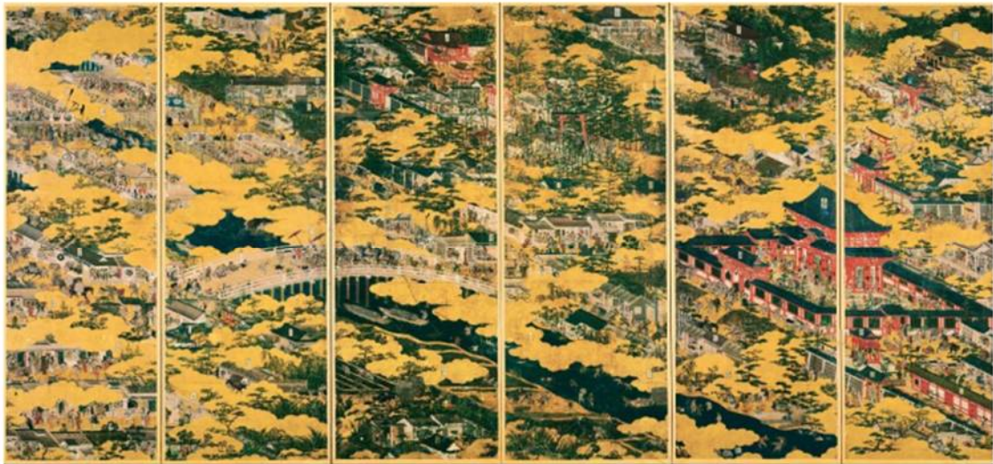
国宝 紙本金地着色洛中洛外図（舟木本） 東京国立博物館蔵